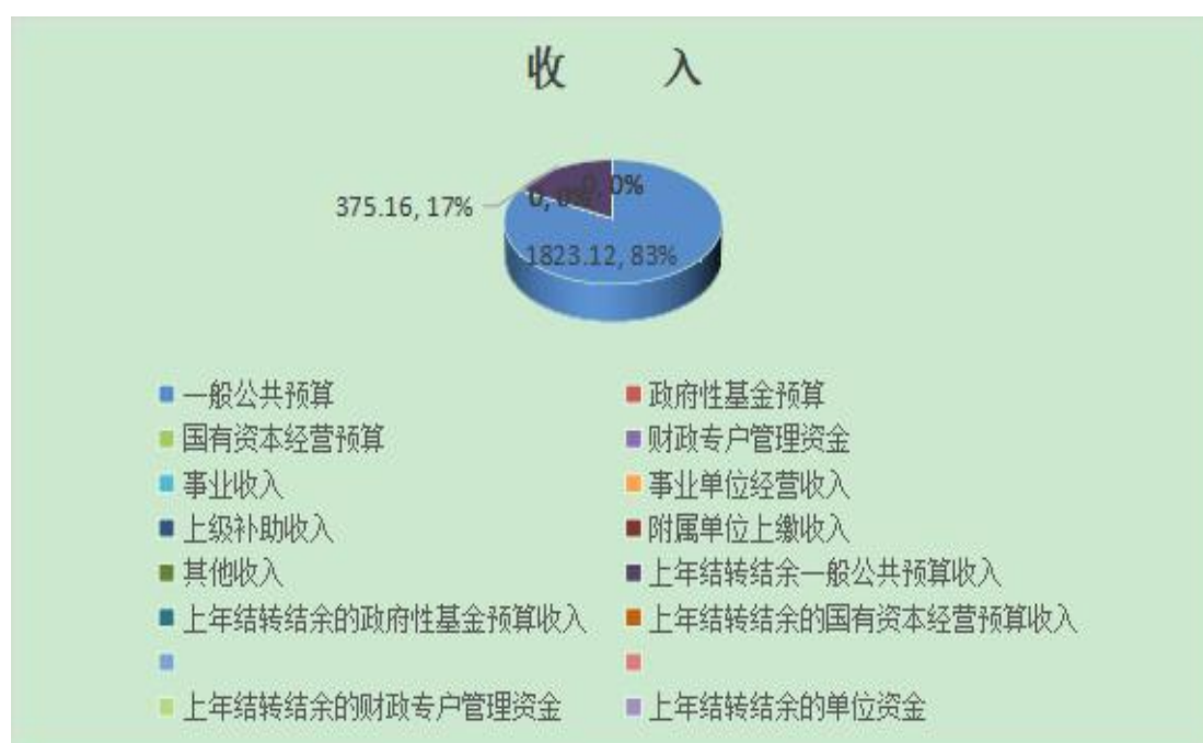
图 1. 收入预算图（可以饼图列示）