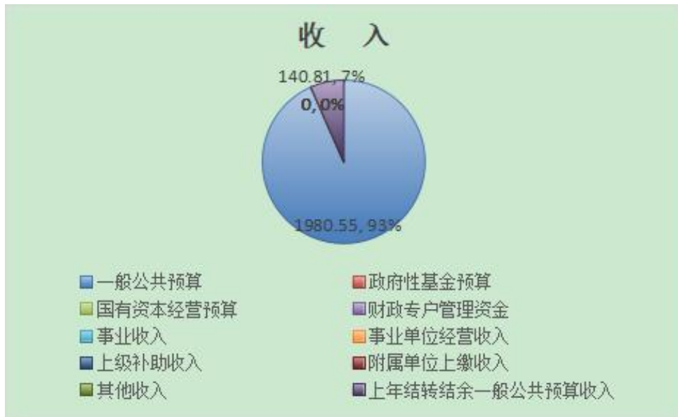
图 1.收入预算图（可以饼图列示）