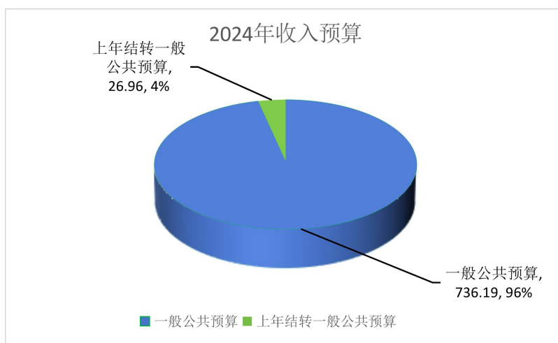
图 1. 收入预算图 (可以饼图列示)

本年国有资本经营预算收入 0 万元，占 0 %； 本年财政专户管理资金 0 万元，占 0 %； 本年事业收入 0 万元，占 0 %； 本年事业单位经营收入 0 万元，占 0 %； 本年上级补助收入 0 万元，占 0 %； 本年附属单位上缴收入 0 万元，占 0 %； 本年其他收入 0 万元，占 0 %； 上年结转结余的一般公共预算收入 26.96 万元，占 3.53 %； 上年结转结余的政府性基金预算收入 0 万元，占 0 %； 上年结转结余的国有资本经营预算收入 0 万元，占 0 %； 上年结转结余的财政专户管理资金 0 万元，占 0 %； 上年结转结余的单位资金 0 万元，占 0 %；