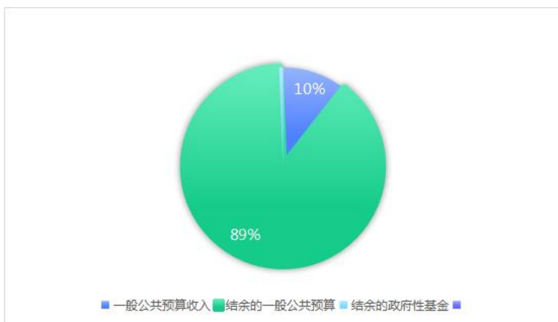
图 1. 收入预算图